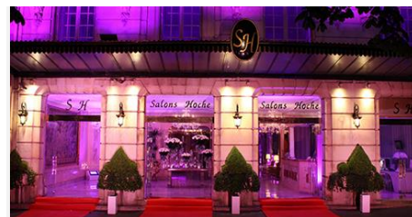
Les salons HOCHÉ 9 avenue Hoche 75008 Paris • FRANCE

Melle. Nassima MOA Chef de projet Tél. : +33 (0)1 46 90 22 30 moa@proximumgroup.com